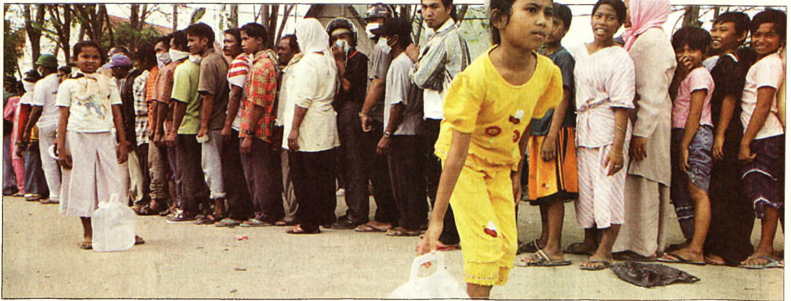
Hosszú sorok: továbbra is gondot jelent a katasztrófa sújtotta övezet egyes területein a tiszta ivóvíz hiánya