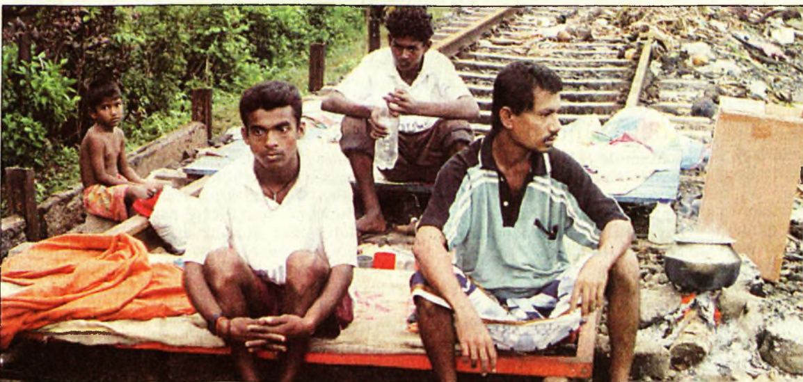
Reménytelenség, fájdalom és lemondás olvasható le a thaiföldi férflak arcáról