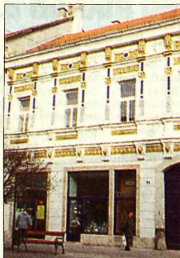
Szépülőben a belváros

Mégpedig azért, hogy a Széchenyi utca visszanyerje régi rangját, ismét megteljen étellel, boltjai küllemükben, kínálatukban méltóak legyenek egy valódi belvárosnak. Az eredmény érdekében az első lépéseket már