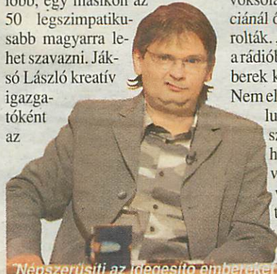
Nepszertísíti az idegesítő embereket