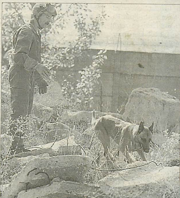
Az ebeket igénybe veszi a mentés, meg is sérülhetnek