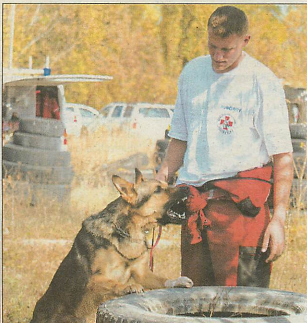
Tasa csak egy éve dolgozik, embert még nem talált

„Hogyan döntjük el, hogy ki legyen az a hat ember, akit küldünk?” – kérdezi Le-