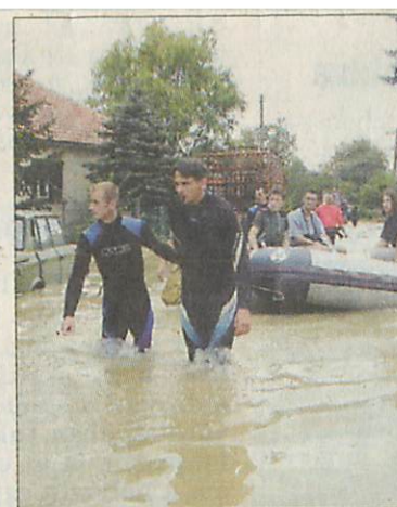
Mentés közben