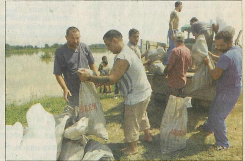
Az emelkedő Hernád mellett a gátépítés is folyik Bőcsnél

a gátakon folyamatos ügyeletet tartanak, nehogy baj történjen.