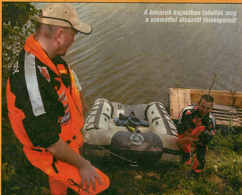
A bűvárok hajnalban találták meg a szeméttel álcázott fémkoporsót

A leghíresebb-leghírhedtebb hordós gyilkos a cinkotai bádogoként ismert Kiss Béla volt, aki a feltételezések szerint több mint tíz nőt ölt meg. A férfi házassági hirdetések alapján ötszáz nővel vette fel a kapcsolatot, de csak azokkal ismerkedett meg személyesen, akik jobb anyagi körülmények között éltek. Ezek a nők aztán szép sorban eltűntek. Kiss Béla 1916-ban bevonult katonának, és vérhasban meghalt a szerb fronton. Az a hír is felröppent, hogy iratot cserélt egy bajtársával és külföldre szökött, többen felismerni vélték később a francia idegenlégió őrmestereként. Cinkotai műhelyének új tulajdonosa fedezett fel négy leforrasztott bádoghordót, amelyekből hét korábban eltűnt, Kissel kapcsolatban álló nő holtteste került elő.