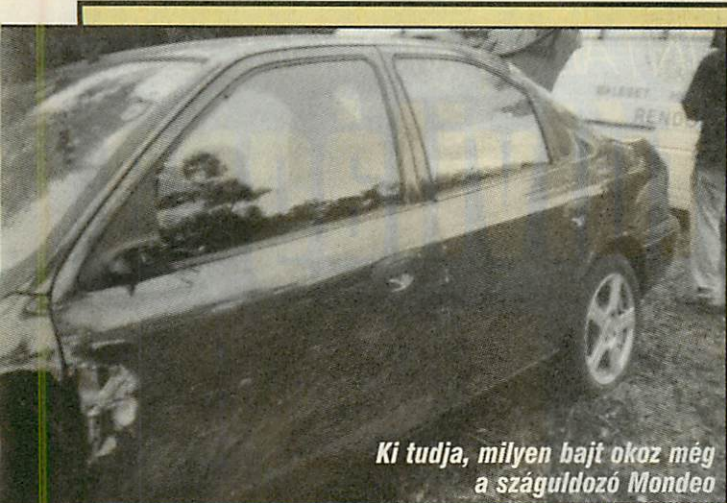
Ki tudja, milyen bajt okoz még a száguldozó Mondeo