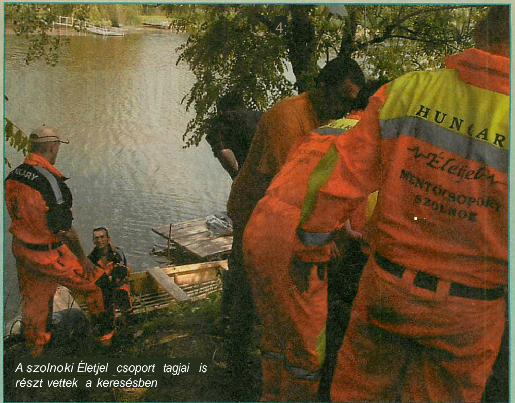
A szolnoki Életjel csoport tagjai is részt vettek a keresésben