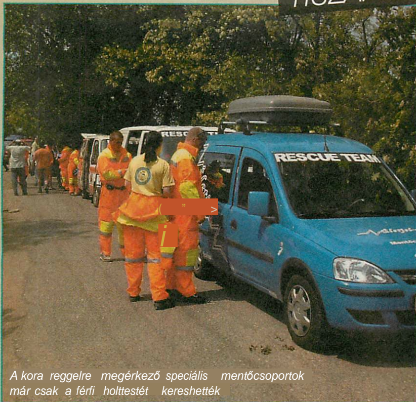
A kora reggelre megérkező speciális mentőcsoportok már csak a férfi holttestét kereshették