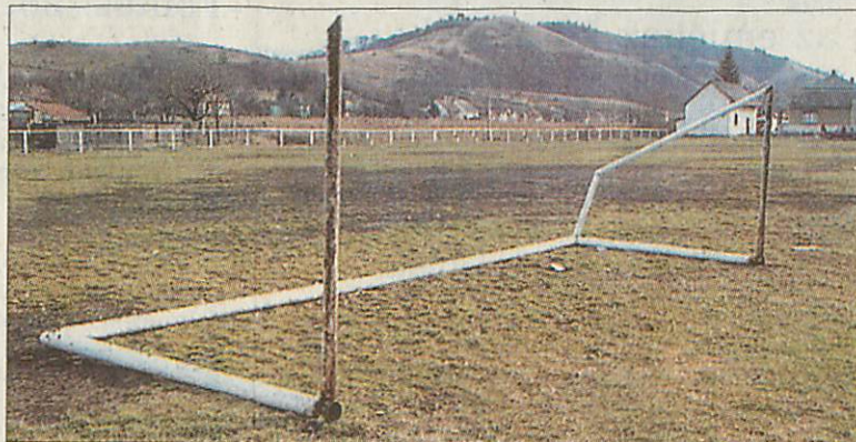
A balesetet okozó futballkapu az arlói sportpályán

den 14.30 órára ért be a Román-kocsi, a sérültet a sebészetre szállították, ahol három sebész-orvos 3,5 órán át végzett rajta műtéteket. Súlyos, életveszélyes