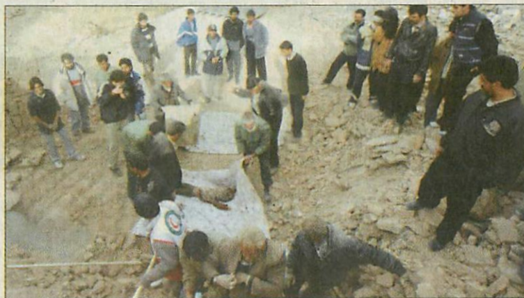
A Korán szerint a halottakat egy nap alatt el kell temetni

Az Ökumenikus Szeretetszolgálat 2001 óta folyamatosan, bejegyzett szervezetként dolgozik az Iránnal határos Afganisztán északi tartományaiban, és most úgy döntött, hogy az afganisztáni iroda munkatársait küldi a katasztrófa sújtotta övezetbe.