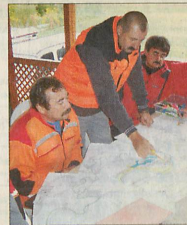
A térkép előtt mindent alaposan megterveztek

pokban aprólékos munkával tevékenykedtek, de fordulat nem történt az ügyben. A rendőrség továbbra is családi állás megváltoztatása büntett alapos gyanúja miatt folytatja ismeretlen tettes ellen a nyomozást. Arra kéri a lakosságot, hogy aki Dávid eltűnésével, tartózkodási, „fellelési” helyével kapcsolatban információval rendelkezik tárcsázza a 107-es segélyhívót vagy a 46/ 514-506-os telefonszámot. Bejelentés tehető a szülők 46/ 307-400-as és 70/ 202-23-84-es számán is.