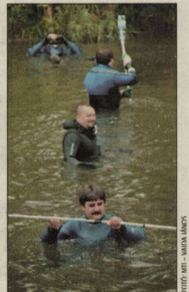
A különleges mentőcsapatok a folyó medrét kutatják át