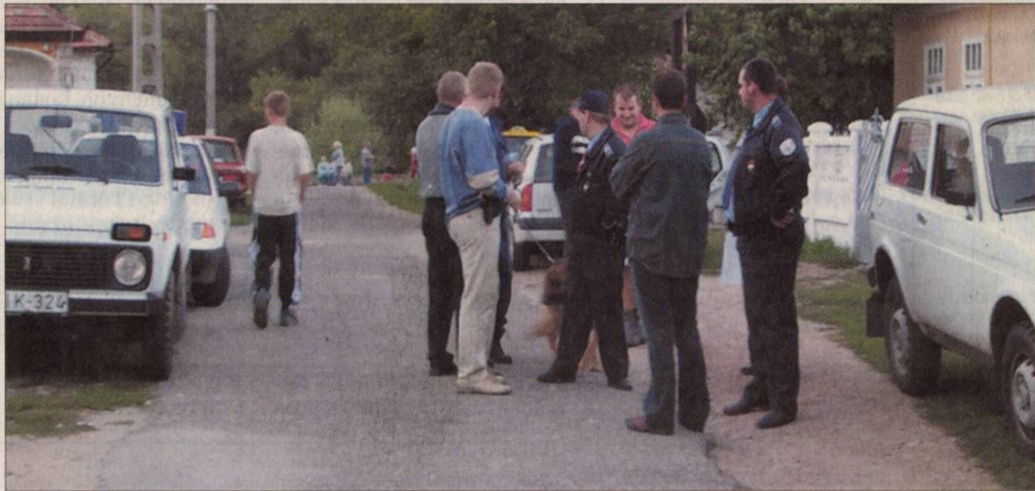
Tanácsalanság: hová lehetett a másfél éves kisfiú?