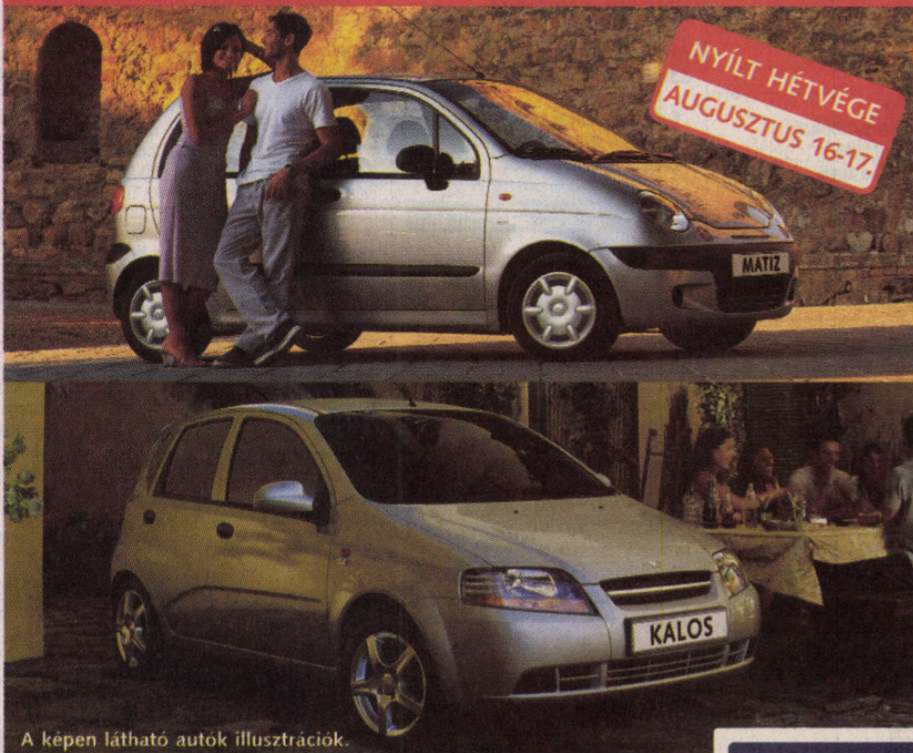
A képen látható autók illusztrációk.