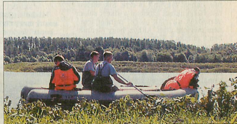
Mancs és a speciális mentők együtt figyelik a vízfelületet

petés érte a rendőröket. Az emberi ürülék tetején észrevették a pénzgyűjteményt, amit a nő a WC-be