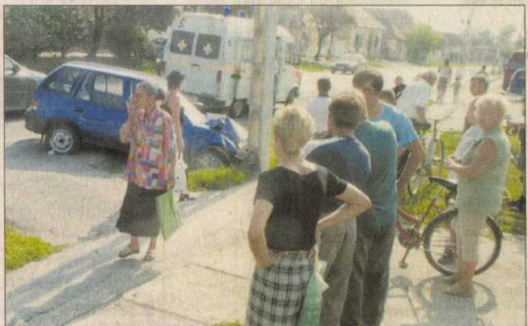
Allig akartak hinni a szemüknek

Az oszlop nem dőlt sem az autóra, sem a járdán lévőkre. A tetejéhez rögzített vezetékek ugyanis állva megtartották. A betonelem cseréjének idejére átmenetileg lezárták a forgalmat, és áramtalanítani is kellett a környéket. A baleset körülményeit a rendőrség vizsgálja.