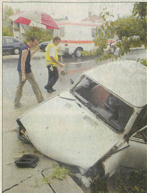
Jócskán megsínylette a Trabant