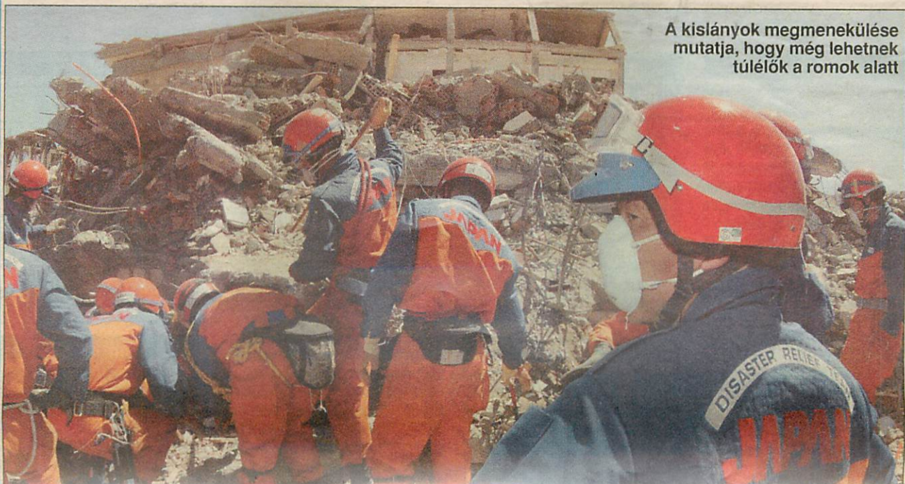
A kislányok megmenekülése mutatja, hogy még lehetnek túlélők a romok alatt