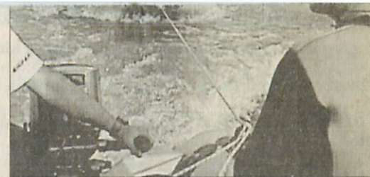
Több csónakkal is kutattak