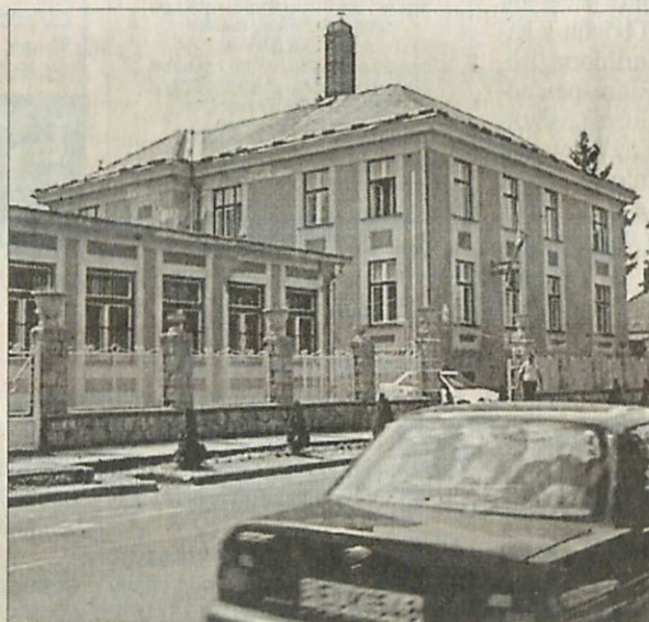
A kapitányság épülete felújításra vár

A kívülről mutató épület rekonstrukciója egyre sürgetőbbé válik. Az esőzések, a nagy mennyiségű hó következtében az épület