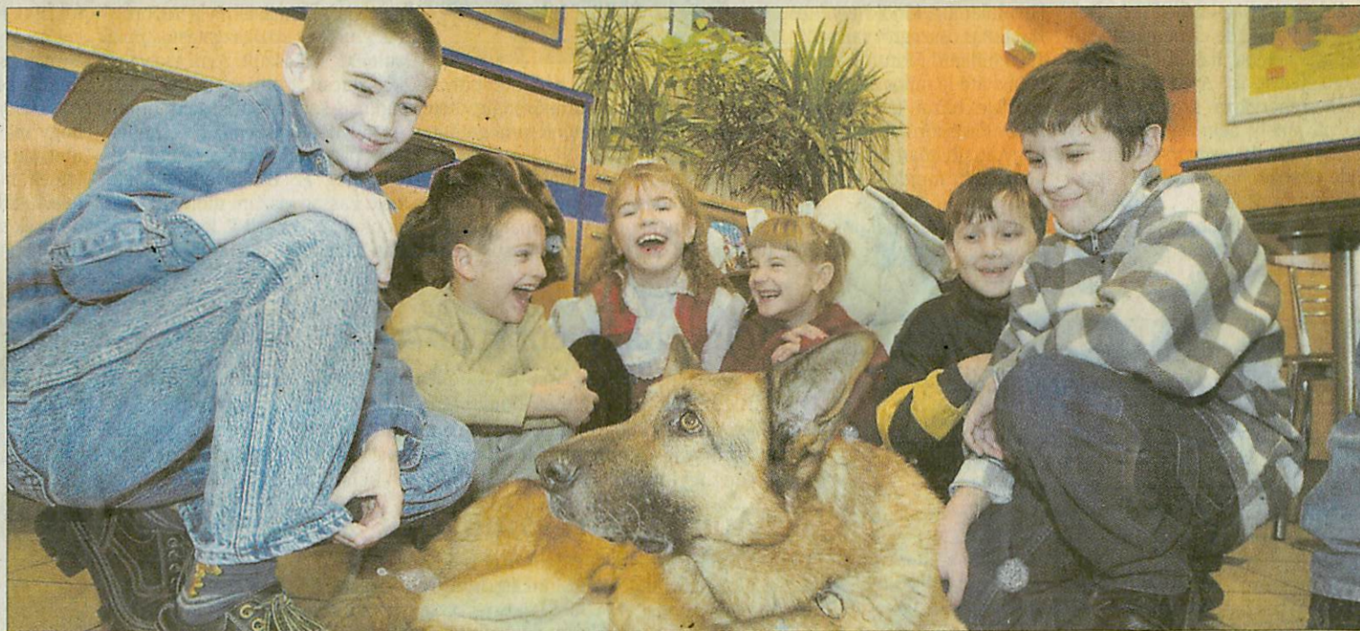
Mancs a gyerekek körében a jelek szerint nem veszített népszerűségéből