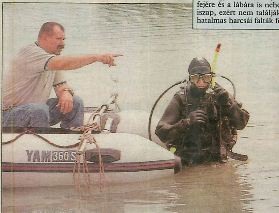
Radarak segítségével kutatnak a búvárok a tóban