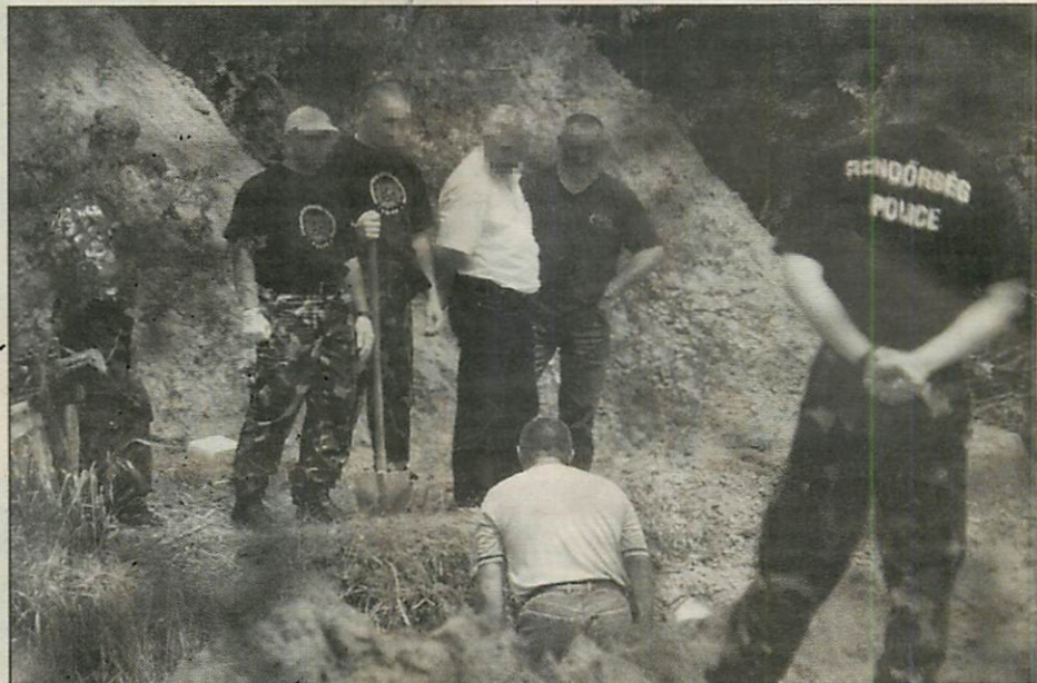
Egész nap kutatott a rendőrség a hullák után

Amint azt a Mai Nap már többször is megírta, a 34 éves Sz. Zoltán első áldozatát négy évvel ezelőtt végezte ki. A rendőrség eddigi ismeretei szerint összesen három nő élete szárad a sorozatgyilkos lelkén: egy 18 és egy 19 éves lánnyal és egy 35 év körüli nővel végzett egy tanyán, majd a kukoricaföldön, illetve a közeli erdőben ásta el a holttesteket. A férfi azonban tegnap két újabb gyilkosságot ismert be, megjelölve a holttestek pontos helyét is. A rendőr-