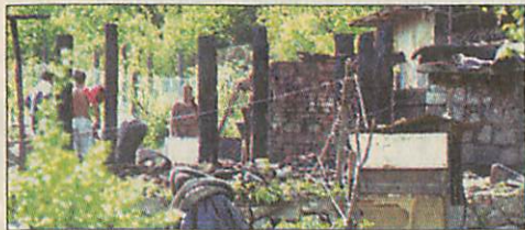
Nem sok maradt belőle

Miskolc (ÉM - PT) - Porig égett a Miskolcon lévő Alsóruzsiban a szombaton kora reggel kigyulladt melléképület. A tűzoltók nagy erővel vonultak a káresemény helyszínére és megakadályozták a lángok továbbterjedését. A tűz keletkezésének oka egyelőre nem ismert.