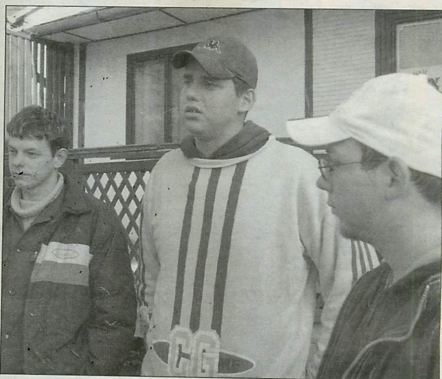
A helyi fiatalok felidéztek a szilveszter éjszakai mulatságon történeteket