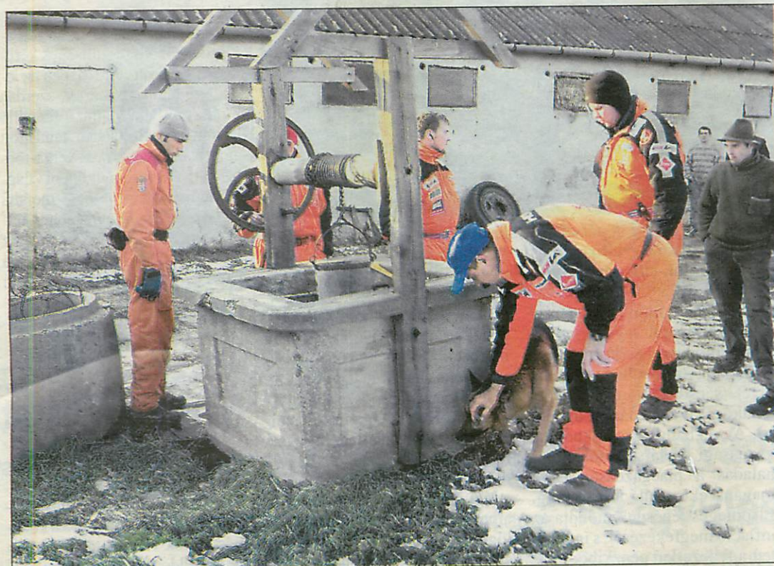
A volt tsz-udvar területét is átvizsgálták a keresőcsoportok

A faluban egyre többen vélik úgy: gyilkosság történt