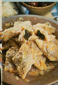
Derelye, sztrapacska, penne 26. oldal