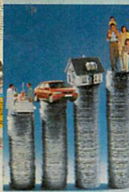
Valamire mindig gyűjteni kell 30. oldaltól