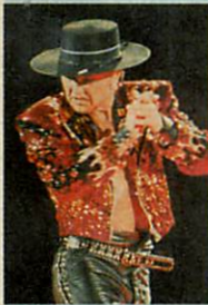
Michael Flatley nem is készült táncosnak 8. oldal