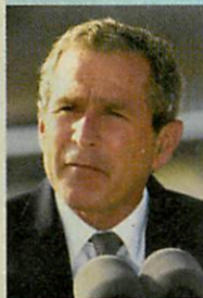
A világ nem akar háborút 18. oldal