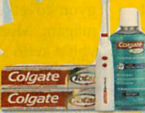
Csodaszépek lesznek a fogai a nyereménnyel 38. oldal