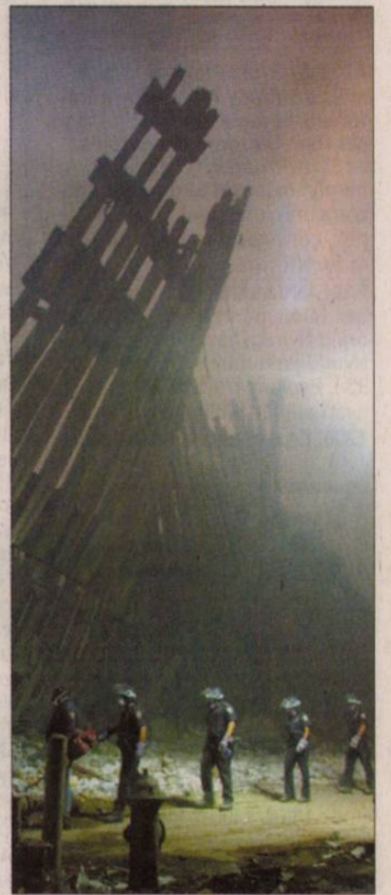
Tűzoltók a romoknál