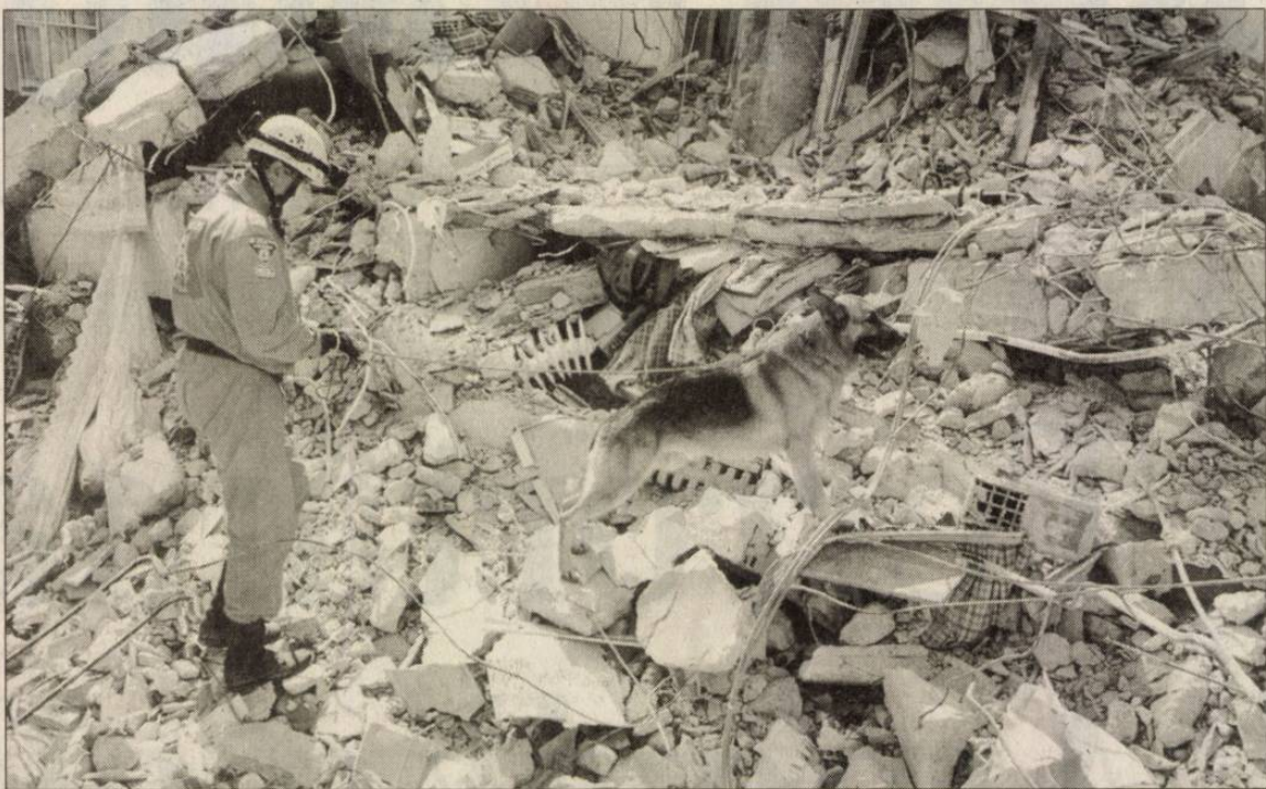
A mentőcsoport számos katasztrófa helyszínén szerzett gyakorlatot

A túlélési esélyek a zárt terekben, amelyekbe por nem jutott be, nagyobbak, ha ezekbe sikerül folyadékot juttatni a bentrekedteknek, napok múlva is kimenthető. Az épületek magas