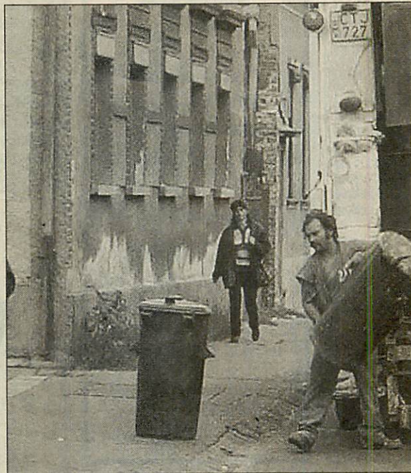
Viszik a szemetünket

Röviden: négy évvel ezelőtti rendeletével az önkormányzat az RWE-t (elődjét) hatalmazta fel arra, hogy kizárólagos szemétszállítóként dolgozzon a megyeszékhelyen. Ám a lakosság egy részének egy másik céggel voltak érvényes szerződésai. Utóbbi is, előbbi is viszi azóta a vele szerződötték (lakásszövet-