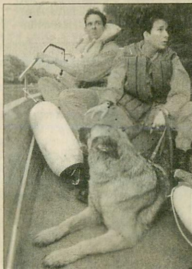
Éltesben a Maroson