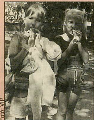
Jóllaktak a papi palacsintával a gyerekek

Szombaton délből a 150 fiatal „süssed Csaba, süssed Csaba!” kiáltásokkal buzdította a papot, aki a tábor egyik vezetőjeként vállalkozott a rekordkísérletre. Végül csaknem háromezer finomság készült el, amelyből egyetlen sem maradt meg. vip