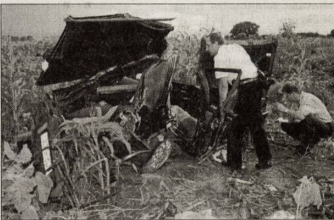
A vasárnap esti balesetben egy fiatal lány vesztette életét, miután az autó a szántóföldre vágódott.