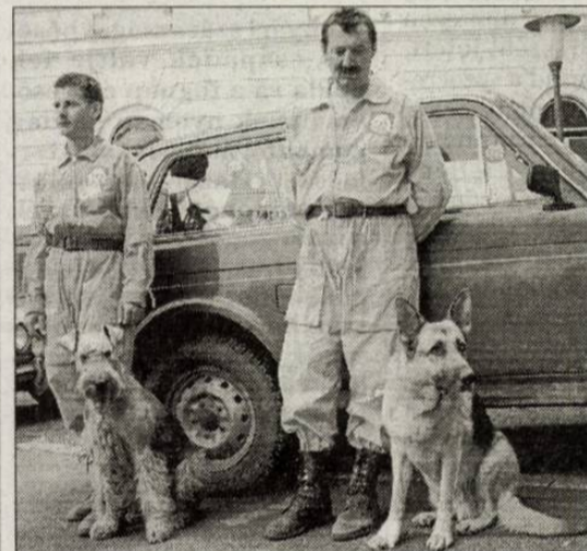
Mancs és Viking időnként „üzemi” balesetet is szenved.