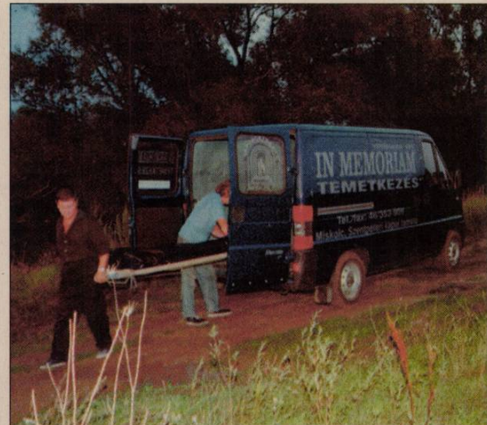
Elszállítják a kislány holttestét.

A Magyar Nemzeti Bank július 26-án kihirdetett hivatalos devizaközépárfolyamai forintban, egy egységre: angol font (GBP) 419,42, német márka (DEM) 133,09, francia frank (FRF) 39,68, japán yen (JPY 100 egység) 253,16, osztrák schilling (ATS) 18,92, svájci frank (CHF) 167,63, amerikai dollár (USD) 276,10, euró 260,31.