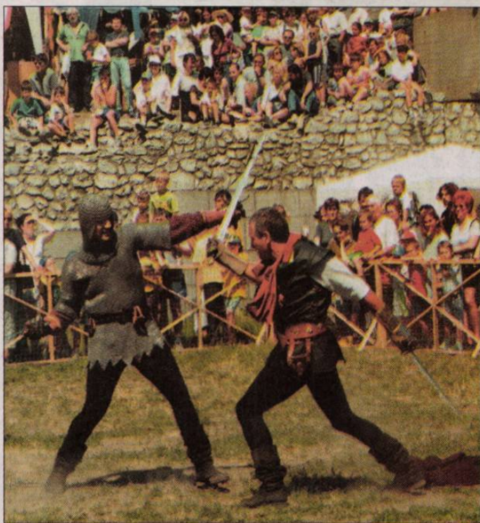
A diósgyőri várjátékokon a Miskolci Haditorna Klub is szórakoztatta a közönséget.

A verőfényes hétvégének, no és persze a színvonalas programsorozatnak köszönhetően több ezren látogattak ki pénteken, szombaton és vasárnap a diósgyőri várba. A millenniumi XV. Diósgyőri Várjátékok pénteken kora délután vette kezdetét, amikor a városháza elé felvonuló gólyalásbasokat, zászlódobálókat, középkori katonákat, udvarhölgyeket, lovasokat, csepürágókat köszöntve Kobold Tamás , Miskolc polgármestere megnyitotta a háromnapos rendezvénysorozatot. Ezt követően a várban megrendezték az általános iskolák között már több hete zajló, Irány a Kárpát-medence című vetélkedő döntőjét, ahol kiderült, hogy végül is a II. Rákóczi Ferenc Általános Iskola diákjai vihették el a fődíjként felaján-