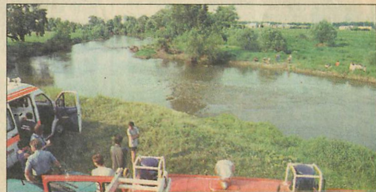
Egész délután keresték az eltűnt lányt

A szakemberek a Miskolci Speciális Mentőcsoport tagjai segítségével folytatták az eltűnt gyerek kutatását.