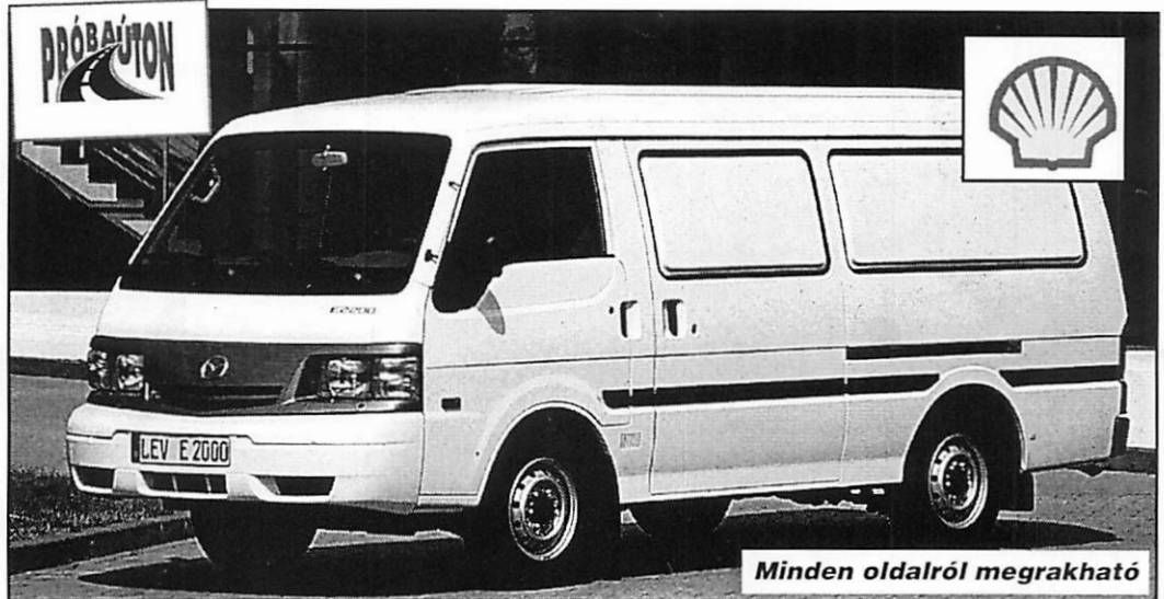
Minden oldalról megrakható

Külső formáját megtartva az autó barátságosabb, a Mazda nemzetközileg használt, megújult, 5 szögletű hűtőrácsát, megnövelt és zöld színű ablakokat, újfajta szélvédő- és antennamegoldást, díszléceket, színre fújt lökhárítót tartalmaz. Az ajtókilincseket és a felnyíló hátsó ajtót biztonságosabbá tette az elhelyezés, ill. a lekerékezés. Az autó belsejében minden a személyautósabb megjelenésre való törekvéstől árulkodik. A műszerfal,