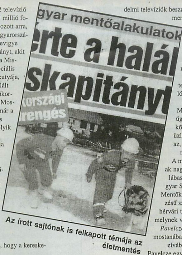
Az írott sajtónak is felkapott témája az életmentés

A TV2 televízió például 5 millió forintot áldozott arra, hogy Magyarországon körbevigye azt a kislányt, akit állítólag a Miskolci Speciális Mentők kutyája, Manecs talált meg Törökországban. Mostanában már a csapból is Manecs folyik (sic). A Nők Lapja például nemrégiben magával Mancsal készített egy interjút... Már korábban is fordult elő olyan, hogy a kereske-