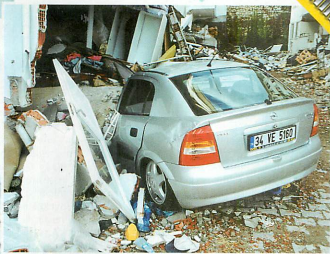
A törökországi földrengéskor az emberáldozatokon felül jelentős anyagi kár is keletkezett