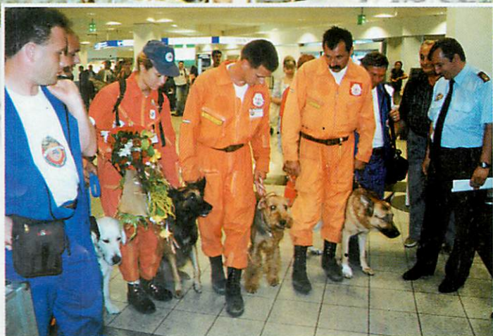
Ferihegyre visszatérve nem győzték fogadni a gratulációkat