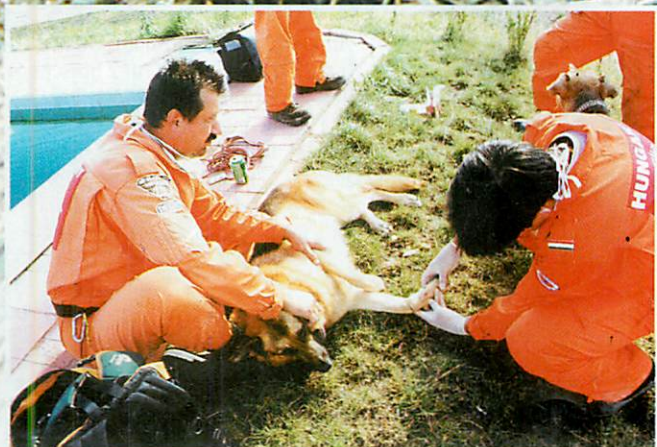
Ekkor még úgy látszott, hogy Mancsnak egy időre betegszabadságra kell mennie, de hamarosan talpra állt