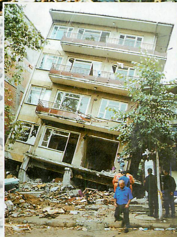
A földrengésbiztosnak vélt házak kártyavárként omlottak össze