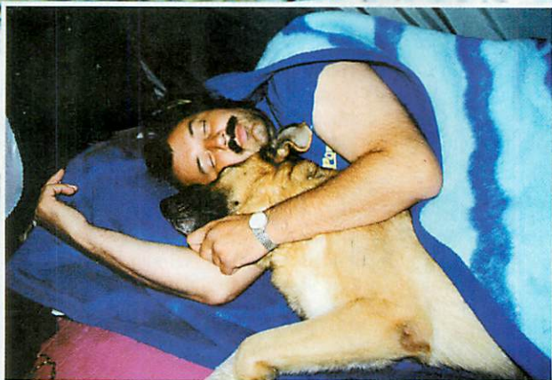
A gazdi mellett édes a pihenés (esetenként napi 18 órás kutatás után). Talán mindketten újabb túlélőkről álmodnak?