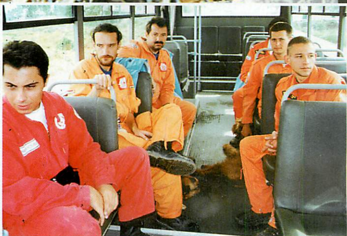
Útban a katasztrófa helyszínére