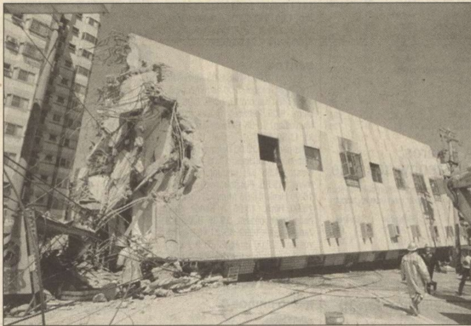
Mincsenben összedől egy épület. Szükségállapotot hirdettek ki

adása viszont már több mint 2000 halálos áldozatról számol be, s több mint 8500-an sebesültek meg. Kezdte a földrengés márciusban, amikor Tajvanon, Tajcsung városának egyes részein (ez a sziget harmadik legnagyobb települése) megszokott az áramszolgáltatás. Szombaton erősen megfogyatkozott a remény, hogy még túlélőkre akadnak a romok alatt, és hatalmas buldózerekkel hozzáláttak a több tonna törmelék eltakarításához. A mentési munkálato-