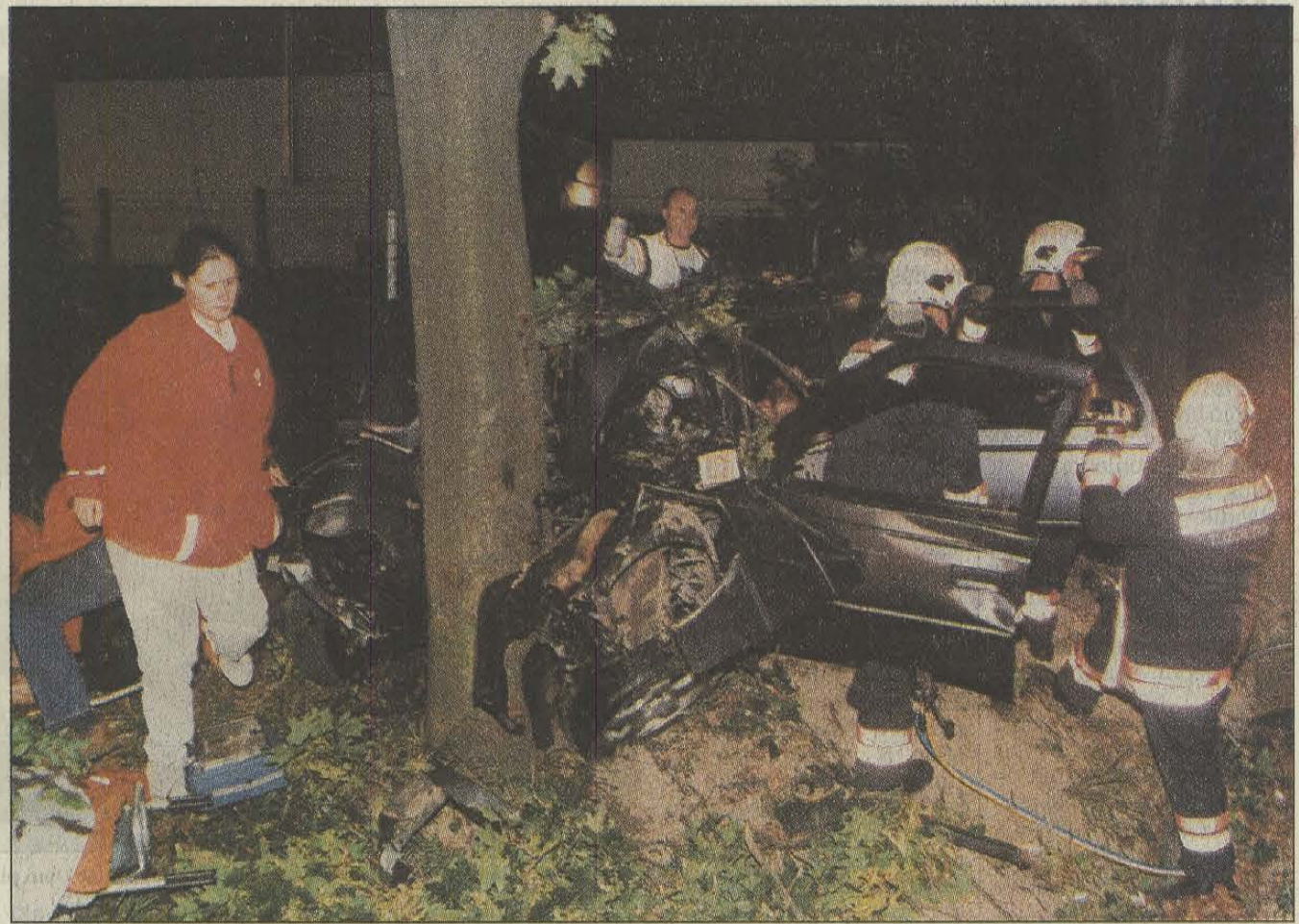
Az M1-es főutat Zsámbékkal összekötő úton eddig tisztázatlan körülmények között egy személygépkocsi egy út menti fának ütközött szeptember 22-én a késő esti órákban. A szerencsétlenül járt gépkocsiban utazó három utas súlyos sérülést szenvedett. A gépkocsivezetőt a helyszínre érkező tűzoltók feszítővágóval szabadították ki a gépkocsi roncsai közül