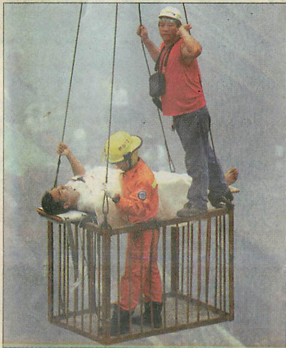
Tűzoltódarus mentőkosárral emelnek ki egy sérültet

A földrengés nyomán sok száz épület omlott össze: közöttük egy 12 eme-