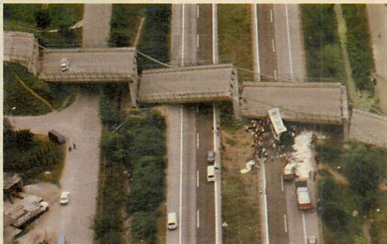
Törökországban óriási élmény volt számomra, hogy megmenthettem egy kislány életét

figyelmét. Sikerült. Aztán mégsem ment olyan simán a dolog, mint ahogy én azt néhány hetes fejjel elgondoltam.