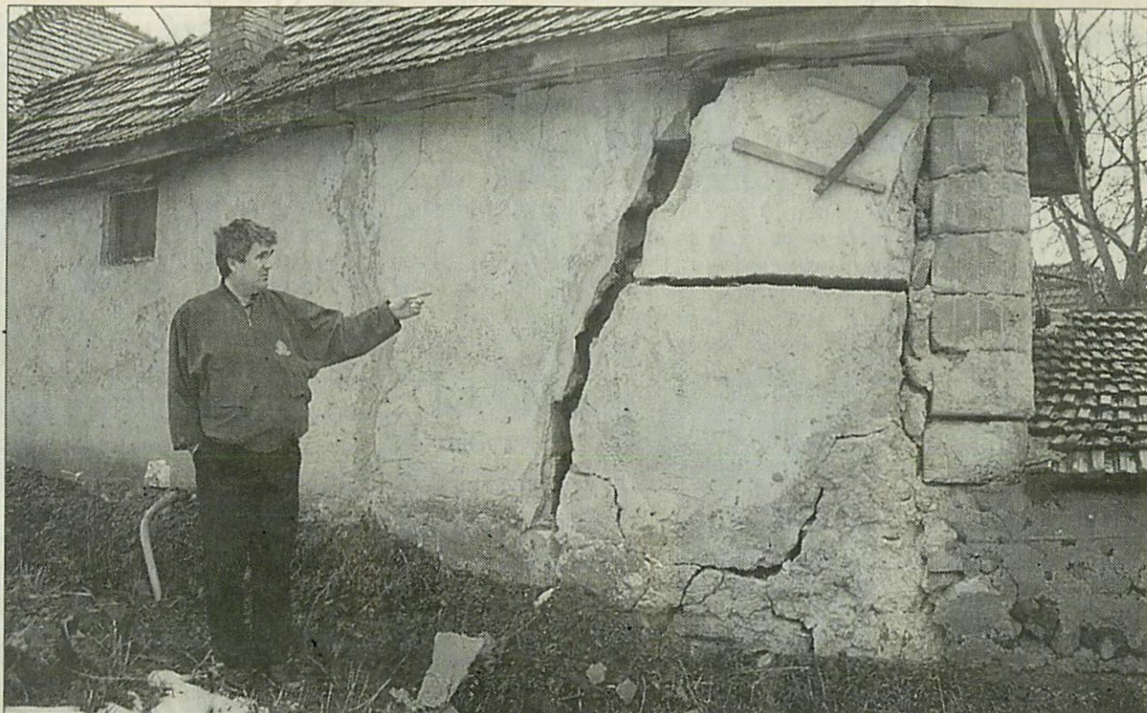
Több épületben súlyos károk keletkeztek

A polgármester szerint a végleges megoldás csak állami pénzből finanszírozható