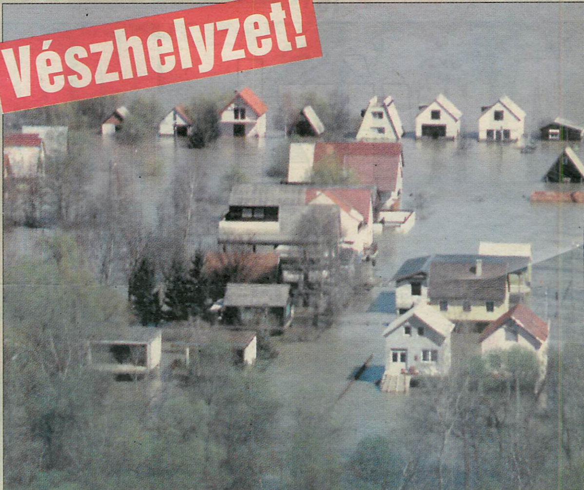
A Bodrogon levonuló árhullám miatt Olaszliszka alacsonyabban fekvő részein víz alá kerültek a házak