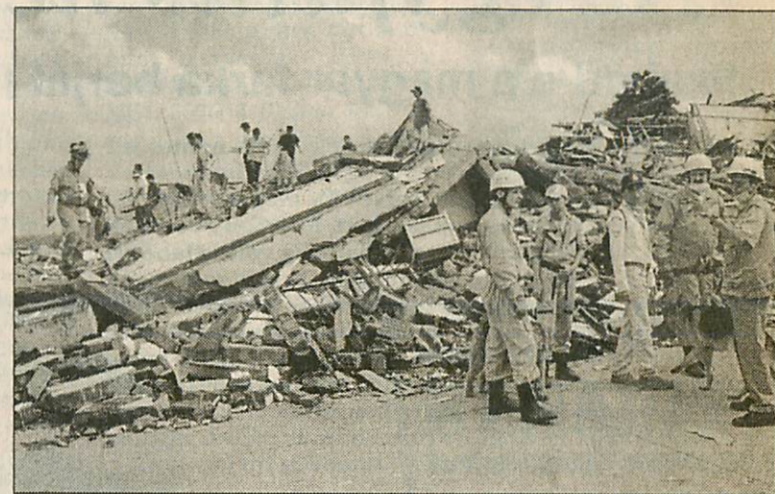
Munka közben a miskolciak.

A nagy meleg és a trópusi esők mellett a latinos szervezetlenség is nehezítette a kolumbiai földrengés áldozatainak a felkutatását, mentését, de a miskolci Speciális Felderítő és Mentőcsoport így is sikeresen teljesítette feladatát. Segíteni utaztak Dél-Amerikába, és számos tapasztalattal gazdagabban tértek haza.