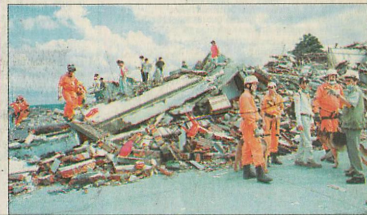
Magyar mentők a kolumbiái romokon

gármestere, illetve a megyei polgári védelem vezetője, Kobold Tamás és Csibi Károly fogadta őket. Itt mondták el: bár már nem számítottak rá, túlélőt is találtak a romok alatt. /2