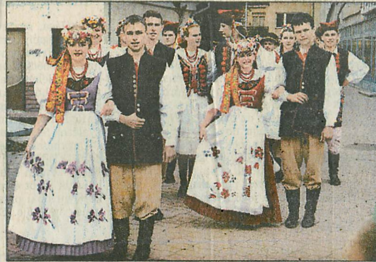
Nagy sikert arattak a népviseletben felvonuló fiatalok

Mezőkövesd és Zory: a testvériség jegyében