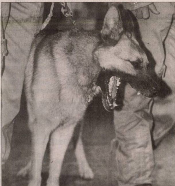
Mancs, a nagyon elfáradt mentőkutyá