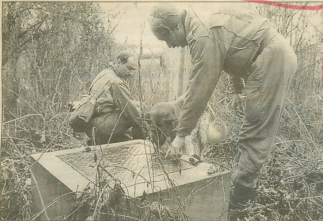
Minden csupa víz és ingovány — de semmi nyomot nem találtak