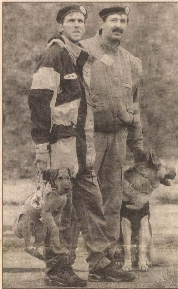
A mentőkutyák most pihentek...

A feltételezett esemény: szerda éjjel a szlovén kormány segítséget kért magyar partnerétől a nagy erejű Ljubjanai földrengés okozta károk felszámolásában, illetve a lakosság mentésében. A két kormány között hatályos egyezmény adott alapot a kéréshez.