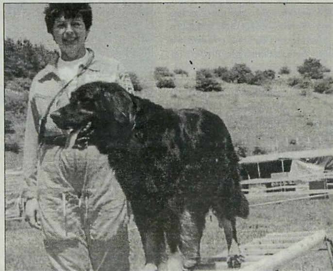
A kép egy korábbi versenyen készült

Miskolctapolcán, a Hejőparton rendezik meg pénteken, szombaton és vasárnap a III. nemzetközi magyar mentőkutyabajnokságot. Pénteken délután 2 órakor fegyelmi pálya, szombaton terepkutatás... Vasárnap délután 4 órakor lesz az eredményhirdetés. A díjak átadása előtt munkakutya-bemutató és technikai eszköz-bemutató is lesz. Mint ismert, a hazai mentőkutya-szövetség azon kivételes egyesületek egyike, amelynek központja vidéken, Miskolcon van.