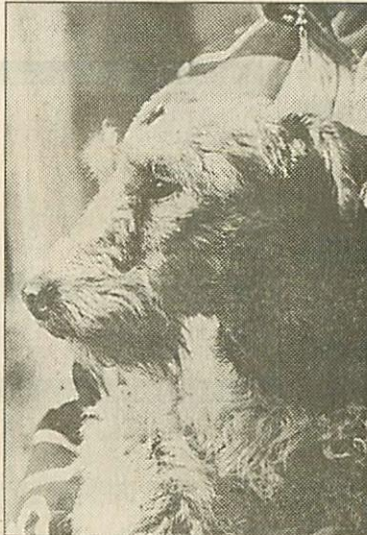
Mentőkutya, bevetésre várva