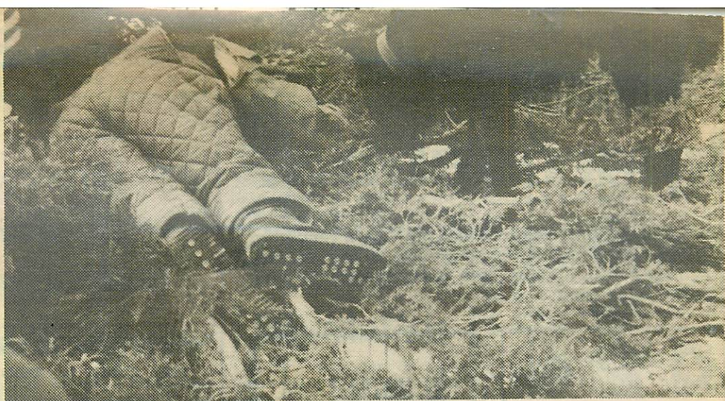
Mentőkutya egy bemutatón.

A privatizáció véges, néhány évre tervezett folyamata során elérendő cél a működő tőke oly módon történő bevonása a gazdaságba, amely együtt jár a fejlett technikai és technológiai, irányítási és piackutatási eszközök és módszerek adaptálásával is. Ennek révén gyorsítani szükséges a gaz-