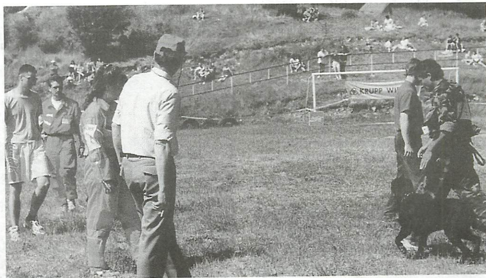
Jolán tudja: a tömeg nem zavarhat...

Azután – a nemzetközi zsűri előtt – megke-zdődtött a „trópusi” nyárban az öt nemzet 71 kutyájának versenye. A magyarokon kívül né-met, osztrák, cseh és szlovén kutyák és a gaz-dák jelentek meg a „startnál”. A résztvevőknek szimatmunkát és fegyelmi gyakorlatot kellett végrehajtani. A szimatmunkában 15 percen be-ül 10-15 ezer négyzetméteres területen két sze-lyt kellett felkutatni. A fegyelmi gyakorlat so-rán pedig a pórázon vezetés, szabadon köve-