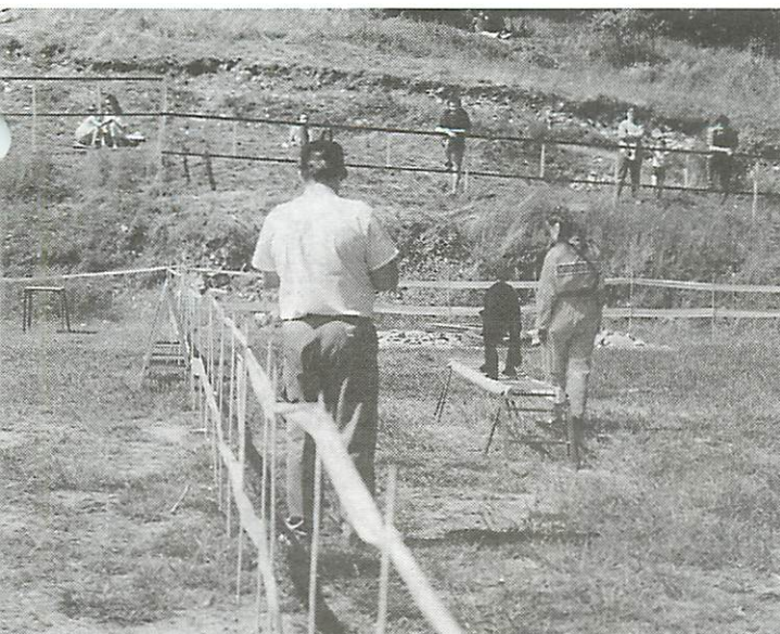
Szépén lassan, nehogy mellé lépünk